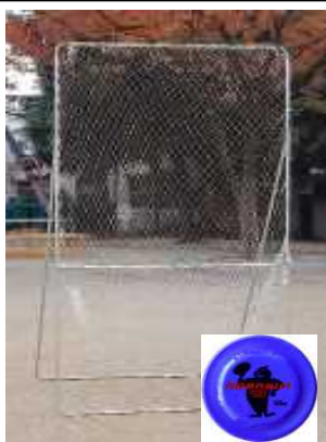
アキュラシーゴール&ディスク