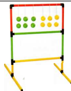
スウィングトスゲーム